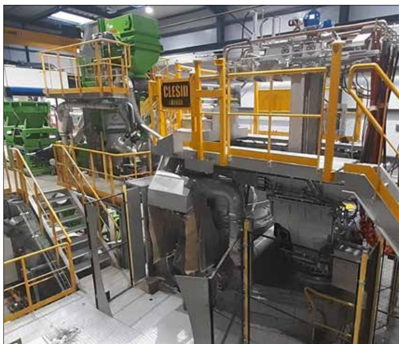
Four pilote plasma