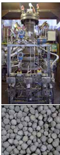
Installation pilote de thermo-conversion HUGO en configuration de "réduction directe" et DRI produit dans le réacteur HUGO

Bien que l'objectif premier soit d'éviter les émissions de CO 2 , la capture du CO 2 sur les fumées industrielles, suivie de la purification et enfin de l'utilisation et/ou du stockage du CO 2 pur, devrait rester une voie importante. C'est pourquoi nous sommes en train de mettre à niveau une installation pilote semi-industrielle de capture du CO 2 basée sur la technologie d'absorption dans un solvant aminé, capable de traiter jusqu'à 1.000 Nm 3 /h de gaz de combustion. Nous offrons ainsi à nos partenaires industriels un outil pour évaluer la technologie d'absorption du CO 2 à grande échelle pour leur application et les aider à atteindre leurs objectifs de réduction des émissions de CO 2 . Le développement de ce pilote se fait en parallèle avec le développement de deux autres installations pilotes de capture du CO 2 , l'une dédiée aux procédés d'adsorption (PSA, TSA, etc.) et l'autre qui sera mobile, pour être utilisée directement sur le site industriel de nos partenaires.