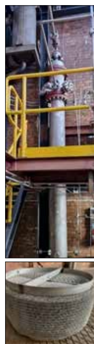
Installation pilote semi-industriel de capture du CO 2